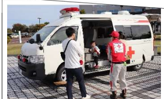
働く車展示 救急車に乗ったよ！

10月6日～11月7日までの間、新町小学校の皆さんが心を込めて制作してくださった段ボール製のホスピタルアートを展示いただきました。