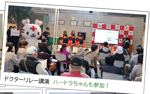
ドクターリレー講演 ハートラちゃんも参加！