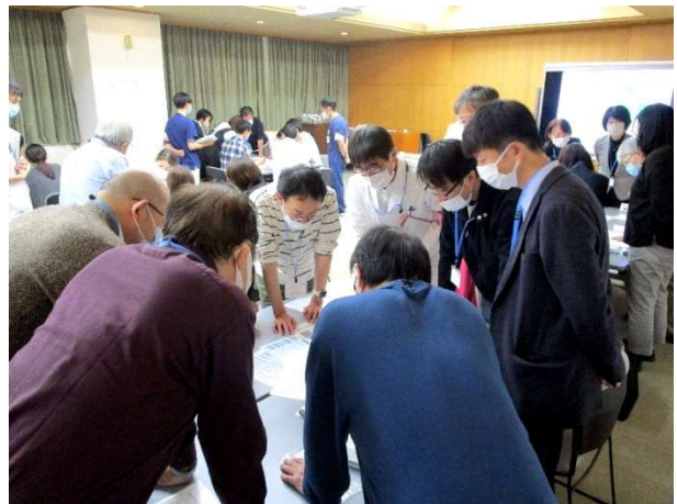
診療所の医師グループが、感染症発生時に必要な情報を迅速に共有している様子

昨年 11 月には、地域で新しい感染症や再び流行してきた感染症が発生した際に備え、「感染症発生時の対応訓練」を実施しました。今回は当院に加え、日頃から連携している医療機関の ICT の皆さま、診療所の先生方、長岡保健所にも参加いただき、地域全体での連携体制を確認しました。