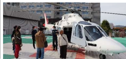
院内見学ツアー すぐ近くでドクターヘリを見学