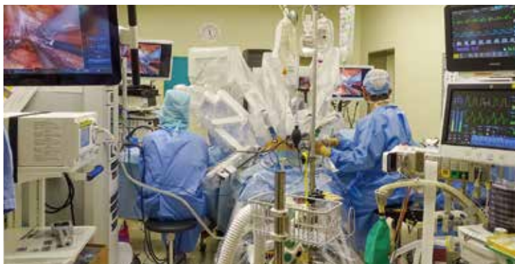
手術器具や内視鏡を取りつけるアームがついたペイシェントカート(ロボット)

なお、ロボット支援手術が保険適用となったのは2012年のRARPが最初で、他の多くの手術に先立って行われてきた歴史がありますが、現在は大腸がんや胃がん、肺がん、子宮がん、腎がん、膀胱がんなど他の多くの病気でもロボット手術が行なわれるようになってきています。今後は当院においても前立腺がん以外の病気にも適応を広げていくこととなります。状況はその都度お伝えしていきたいと思しますので、今後ともよろしくご依頼致します。