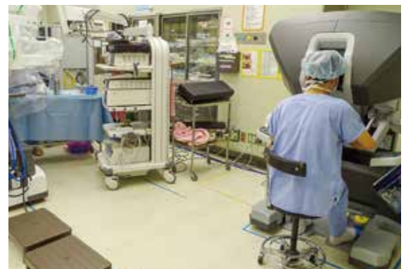
執刀医は患者さんから離れた操縦席でアームを操作します